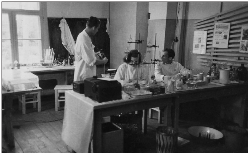
Bērziemā iekārtotā laboratorija