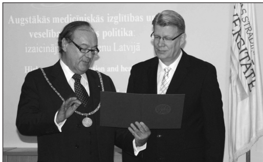
EZMA prezidents F. Ungers pasniedz Latvijas Valsts prezidentam Valdim Zatleram EZMA protektora diplomu