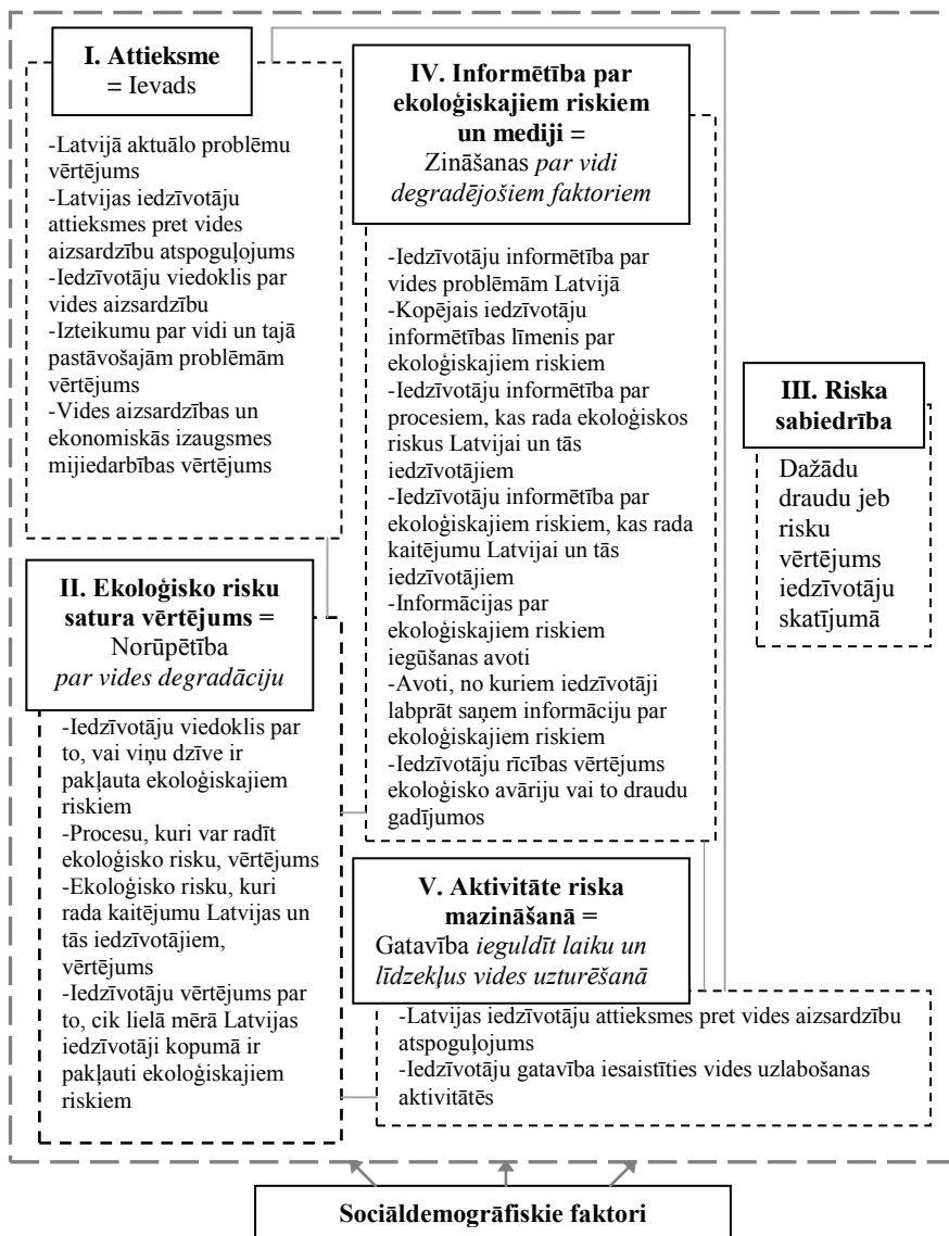
2. attēls. Pētījuma modelis 4