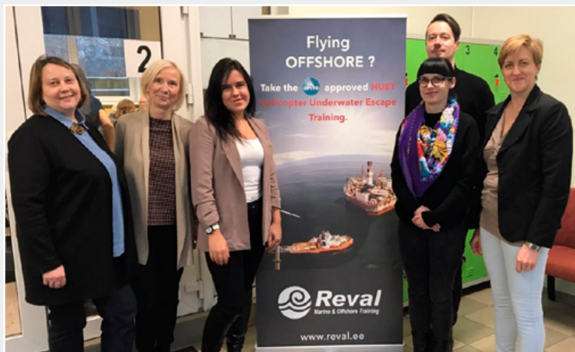
OnBoard-Med projekta dalībnieki.

un aptauju datiem. Tika skatīti jautājumi par stresa jēdzienu un fizioloģiju, distresa ietekmi uz organismu, profesionālās dzīves kvalitāti un izdegšanas sindromu, kā arī laika menedžmentu un efektīvu plānošanu. Pirmā kursa pilotprojekta realizācija veiksmīgi notika 2018. gada janvārī Daugavpilī, Daugavpils reģionālajā slimnīcā, un tajā piedalījās 56 dalībnieki. Nākamā pilotprojekta realizācija notika Liepājā, VSIA “Piejūras slimnīca”, ar 47 dalībniekiem un pēdējā – Rīgā, Rīgas Stradiņa universitātē, 2018. gada februārī, kurā bija 81 dalībnieks. Visi dalībnieki bija aktīvi, veica praktiskus darbus, kā arī sniedza atgriezenisko saiti, novērtējot studiju programmas kursa saturu. Projekta īstenošana notika no 2016. gada 1. septembra līdz 2020. gada 28. februārim.