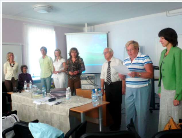
Valsts pārbaudījuma komisija darbā RSU Liepājas filiālē 2007. gadā