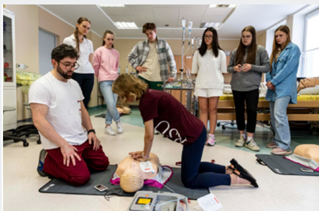
Jauno māsu akadēmijas dalībnieki nodarbības laikā, 2023. gads

Visinteresantākās skolēniem šķiet praktiskās nodarbības, kurās simulāciju veida apmācību ciklā veic manipulācijas, vitālo rādījumu un antropometriskos mērījumus, sniedz pirmo palīdzību. RSU Māszinību un dzemdību aprūpes katedras un Medicīnas izglītības tehnoloģiju centra (MITC) docētāji plāno un realizē nodarbības, sagatavo skolēniem dažādus uzdevumus. Nodarbību laikā notiek gan paraugdemonstrējumi, gan treniņi un sacensības.