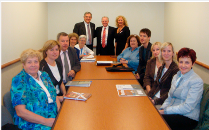
Sadarbības līguma starp RSU un Bellarmines Universitāti parakstīšana 2008. gadā

2008. gada vasarā Rīgas Stradiņa universitātē viesojās četri docētāji no Bellarmines Universitātes, kas atrodas ASV, Luisvilā. Viņi piedalījās studiju procesā ar vieslekcijām, kā arī tikās ar docētājiem.