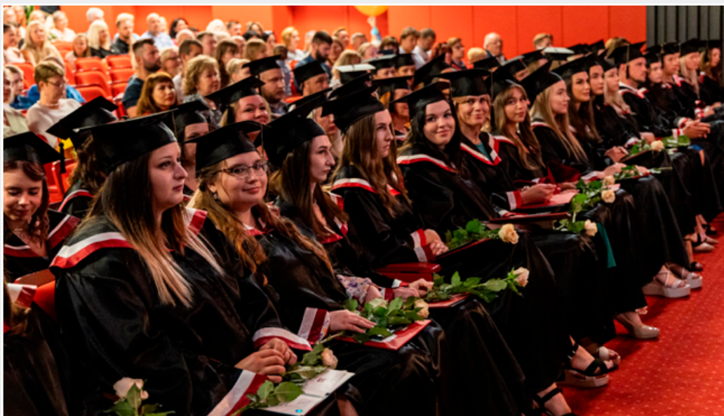
Bakalaura studiju programmas “Māszinības” studentu izlaidums RSU Liepājas filiālē 2023. gadā