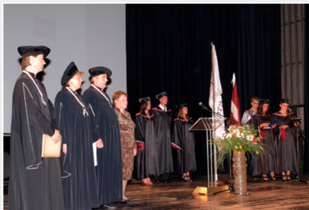
Izlaidums Liepājas filiālē 2011. gadā