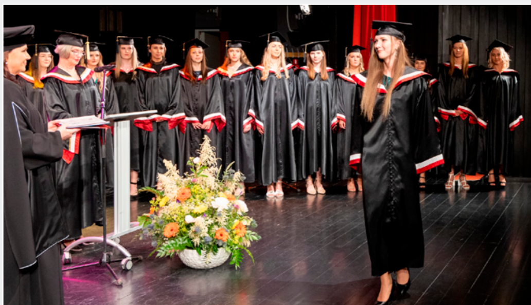
Bakalaura studiju programmas “Māsinības” studentu izlaidumā RSU Liepājas filiālē 2022. gadā

Saskaņā ar jauno māsas profesijas standartu kopš 2022. gada profesiju var apgūt tikai profesionālā bakalaura studiju programmā, tādējādi tiek nodrošināts vienots izglītības process, māsas iegūst lielāku mobilitāti nozarē, viņu zināšanas ir plašākas