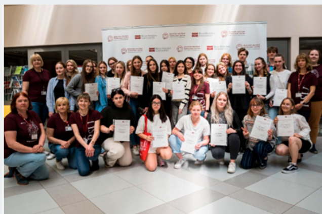
2023. gada Jauno māsu akadēmijas dalībnieki