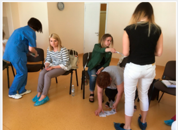
Maģistra studiju programmas “Māsinības” studenti nodarbības laikā Daugavpils reģionālās slimnīcas telpās 2018. gadā