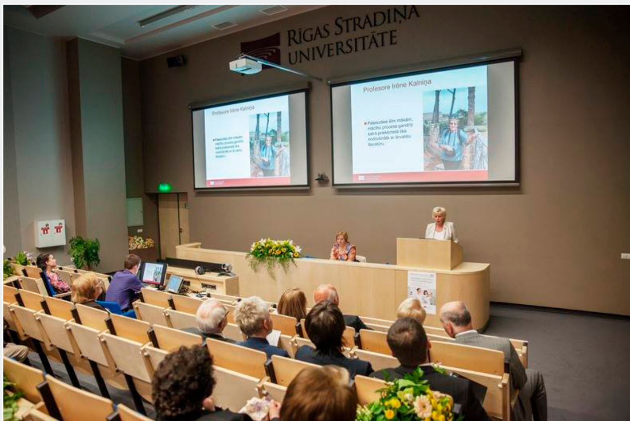
Māzinību fakultātei – 20 svinīgais pasākums