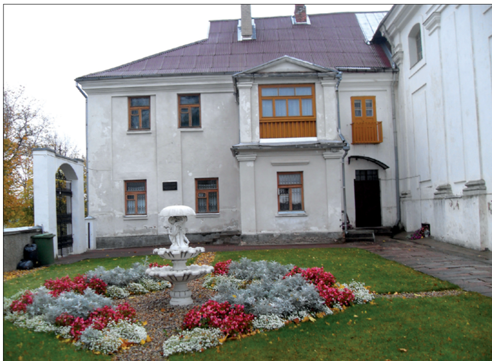
Bijušā garīgā semināra ēka (pirmā augstākās izglītības mācību iestāde Latvijā), darbojās no 1757. līdz 1844. gadam pie Krāslavas Svētā Ludvika Romas katoļu baznīcas, 2016. gads