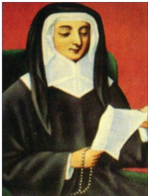
Luīze de 'Marilaka ( Louise de Marillac , 1591–1660)

Priesterim aktīvi palīdzēja māsa Luīze de Marilaka ( Louise de Marillac , 1591–1660). Viņa piedzima Parīzē un bija ārlaulības bērns (māte nav zināma, tēvs – aristokrāts). Luīze de Marilaka uzauga dominikāņu klosterī Posī ( Poissy ) ļoti reliģiskā vidē un ieguva labu izglītību. Viņa brīvi jutās gan aristokrātiskā, gan nabadzīgu ļaužu sabiedrībā. Kopš bērnības viņa sapņoja iestāties kapucīnu ordenī, tomēr sliktās veselības dēļ Luīze tajā netika uzņemta. Šī neveiksme nemazināja viņas vēlmi ziedot savu dzīvi kalpošanai Dievam.