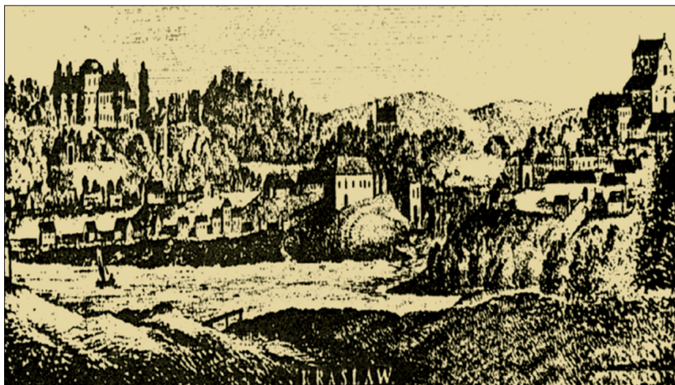
Krāslavas skats no Daugavas: starp pili un baznīcu redzams rātsnams ar torni. Napoleona Ordas 77 gravūra, glabājas Krāslavas vēstures un mākslas muzejā