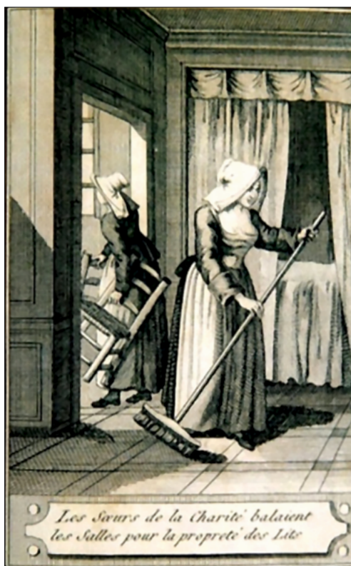
Žēlsirdīgās māsas slauka māsu namu. Mākslinieks un laiks nezināms

Pakāpeniski Luīze de Marilaka mainīja savu attieksmi pret žēlsirdīgo māsu strādāšanu slimnīcās un piekrita, ka māsas tur īsteno savu misiju. Tomēr viņa uzstāja, lai māsas nesniegtu palīdzību pacientiem ar veneriskajām slimībām. Luīze de Marilaka bija pārliecināta, ka ar šīm slimībām sirgst tikai morāli pagrimumuši cilvēki. Joprojām viņa neuzticējās ārstiem. Arī dažus gadus vēlāk, kad 1651. gadā saslima viņas dēls, Luīze de Marilaka negribēja meklēt ārstu palīdzību.