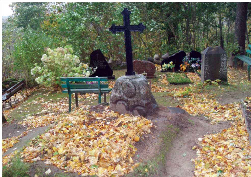
Priestera Vincenta de Paula apvienības žēlsirdīgo māsu atdusas vieta Krāslavas katoļu kapsētā, vecajā sektorā, 2016. gads

Vincenta de Paula žēlsirdīgo māsu darbība Krāslavā, viņu rīcība un attieksme pret cilvēkiem kļuva par pamatu vairākiem medicīnas māsu profesijas pamatprincipiem, kas ir attīstījušies un sasnieguši mūsdienas.