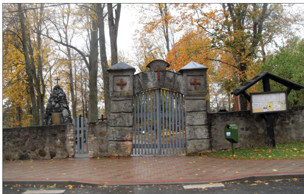
Krāslavas pilsētas katoļu kapi, centrālā ieeja, 2016. gads