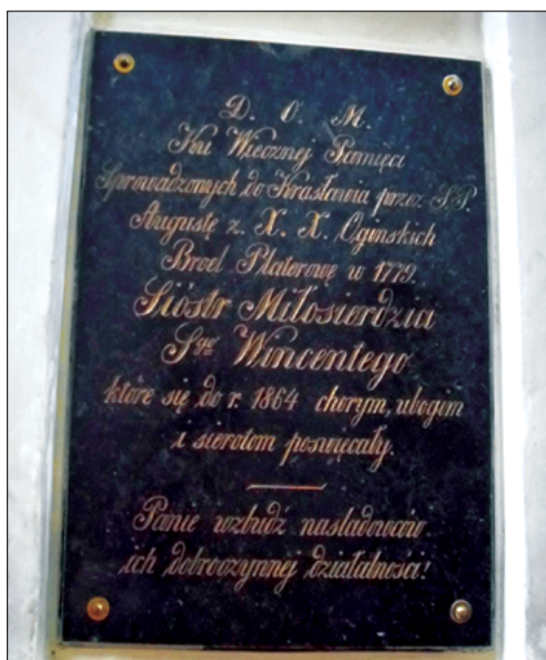
Plāksne žēlsirdīgo māsu piemiņai Krāslavas Svētā Ludvika Romas katoļu baznīcā