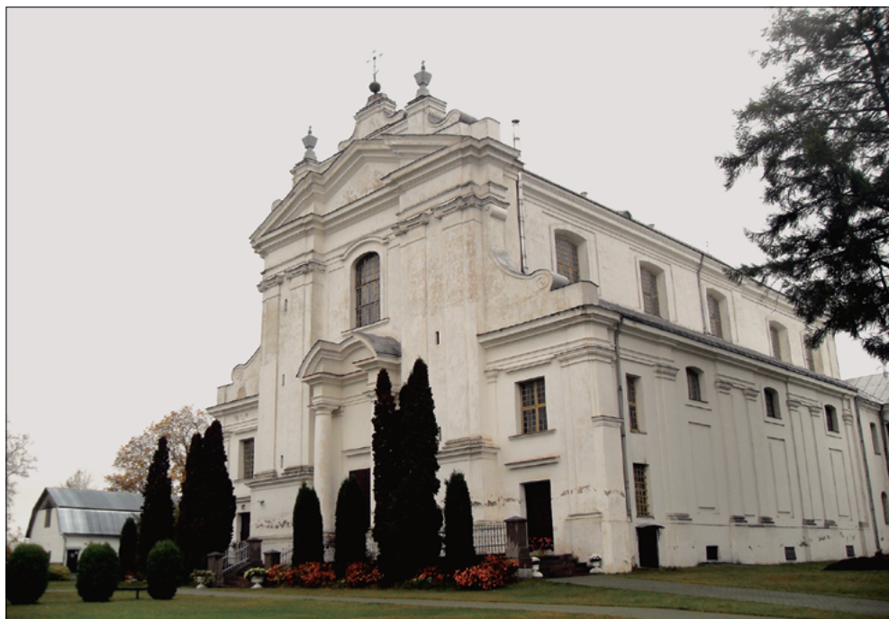
Krāslavas Svētā Ludvika Romas katoļu baznīca, uzbūvēta 1767. gadā. Šajā dievnāmā atdusas Plāteru dzimtas pārstāvji, 2016. gads

Par vēsturiskajiem notikumiem liecina kapavietas un piemiņas zīmes.