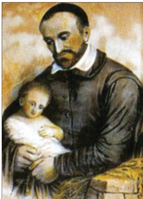
Vincents de Paula ( Vincent de Paulo , 1581–1660)

Ar priestera Vincenta de Paula ( Vincent de Paulo , 1581–1660) vārdu saistās “žēlsirdīgās armijas” sākumi Francijā, no kurienes tā izplatījās Eiropā, kā arī “žēlsirdīgās māsas” jēdziena lietojums.