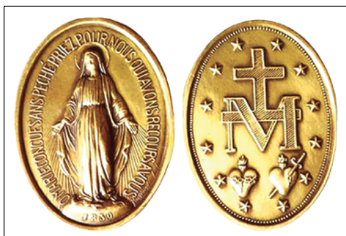
Jaunavas Marijas medaljons

Medaljona reversā attēlota Sv. Marijas vieta Jēzus sakramentā un viņa baznīcā. Viņa tik stipri ir savienota ar savu dēlu, ka burts “M” iestrādāts medaljonā kopā ar Krustu. Viņas sirds, pārdurta ar zobenu, atrodas pie Jēzus sirds dzeloņainā vainagā. Divpadsmīt zvaigznes simbolizē divpadsmīt baznīcas apustuļus. 56