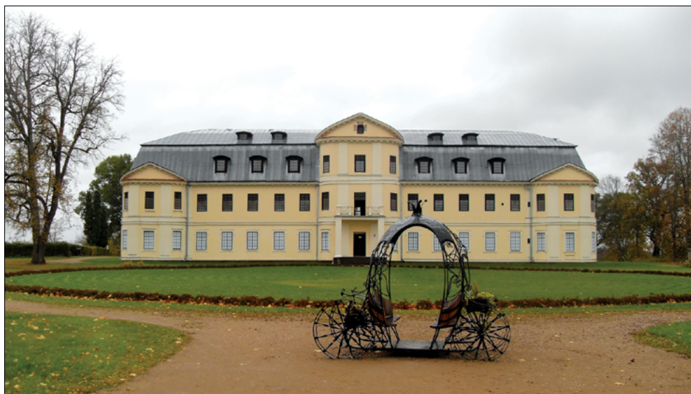
Grāfu Plāteru pils Krāslavā, uzbūvēta 1791. gadā, celtne ir 18. gs. valsts nozīmes arhitektūras piemineklis, 2016. gads