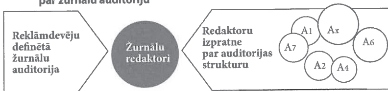
Grafiks nr. 5. Reklāmdevēju un redaktoru izpratne par žurnālu auditoriju

Reklāmdevēju prasības un vēlamo žurnālu lasītāju raksturojums ietekmē redaktoru izpratni par savu auditoriju un liek šai izpratnei piemērot arī atbilstošu saturu. Tā kā abu komunikācijas procesa dalībnieku rīcībā pārsvarā ir kvantitatīvi dati, tad šī izpratne kļūst līdzīga, atbilstoša kvantitatīvo datu piedāvātajām iespējām un to interpretācijai. Turklāt reklāmdevēji ļoti skaidri definē savas gaidas, kas attiecas uz žurnāla auditoriju, toties redaktoru uztverē auditorija, tās uzvedība un vajadzības ir daudz neskaidrākas, tās nevar viennozīmīgi saistīt ar žurnāla satura piedāvājumu.