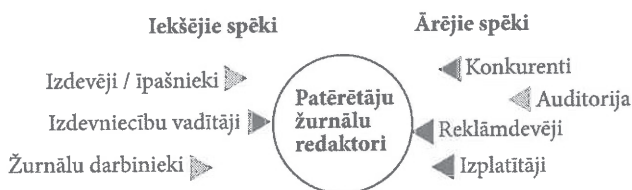
Grafiks nr.3. Žurnālu redaktorus ietekmējošie spēki

Grafiks nr.3 parāda, ka redaktora darbā visspēcīgākā ir izdevniecību vadītāju un reklāmdevēju ietekme. Būtībā reklāmdevēji ietekmē redaktoru darbu divējādi: tieši, kontaktējoties ar redaktoriem, un ar izdevniecību vadītāju palīdzību, jo izdevniecību menedžments veido noteikumus un politiku, kas nosaka reklāmdevēju un redaktoru mijiedarbību. Nozīmīga ir arī izdevēju/īpašnieku ietekme: tā var būt tieša kontakta veidā un darboties pastarpināti, izvirzot mērķus izdevniecību vadītājiem. Darbinieku ietekme uz redaktoru nav nozīmīga, jo viņiem jāievēro izdevēju „spēles noteikumi”, kurus savukārt izpilda redaktori.