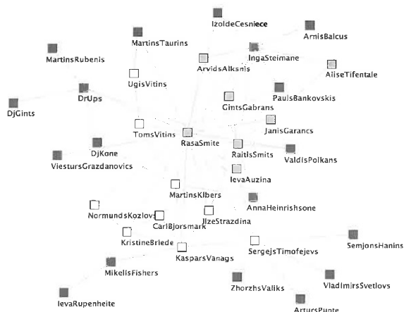
1. attēls. E-Lab lokālās kopienas tīklojuma dalībnieku sociālā karte

1. Latvijā 20. gs. 90. gadu vidū sāka parādīties pirmās jaunās laikmetī- gās mākslas tendences un subkultūru formas, kas radušās globalizācijas ietek- mē, tika pārnestas uz dažādiem lokāliem kontekstiem. Jauno mākslinieku, mūziķu, dīdžeju, klubu pasākumu organizētāju, modes dizaineru, dzejnieku un citu radošu jaunu cilvēku “dzīvās” formācijas manifestējās kā tehno mūzi- kas kultūras un eksperimentālās mākslas hibrīds. Kā viens no pirmajiem “ko- nektoriem”, kas ne tikai ieviesa jaunās tehnokultūru Latvijā, bet arī izveidoja jaunus savienojumus starp tā laika aktīvākajiem radošajiem cilvēkiem bija Kaspars Vanags un Ilze Strazdiņa un viņu dibinātais projekts Open . “ Meklējot tādu vidi (kur man būtu interesanti), laikam es vienkārši sakūļāju to visu kopā, nu tā tīri pat negribot varbūt ” [intervija ar Vanagu]. Šādus pasākumus tik vienkārši nevarēja nosaukt par “subkultūrām” vai “tehno pārtijām”, tiem bija liels mērogs – tie iesaistīja lielu skaitu dalībnieku un apmeklētāju, bet tie vēl nebija komerciālie “reivi”. “ Šīs izpaušmes kopumā manifestēja alternatīvu rea- litāti, kas drīzāk liecināja par jaunu uztveri, par fundamentālām pārmaiņām sabiedrībā ” [Kluitenbergs]. Šādā enerģiski piesātinātā Rīgas grass-roots kultū- ras vidē 1996. gadā savu darbību uzsāka E-Lab .