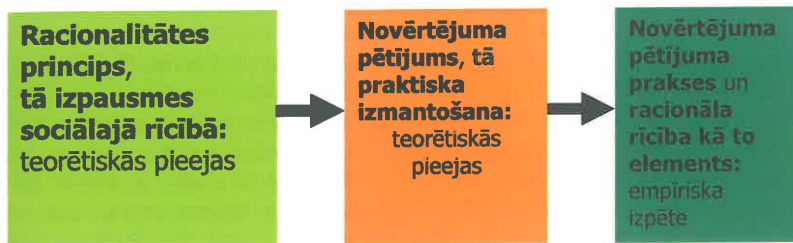
1. att. Promocijas darba loģika